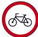
ZABRANA PROMETA ZA BIKIKLE