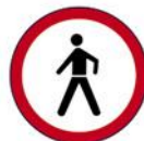
ZABRANA PROMETA ZA PJEŠAKE